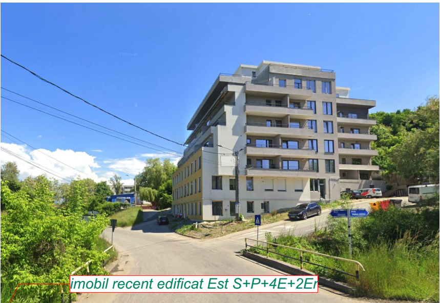
imobil recent edificat Est S+P+4E+2Ei