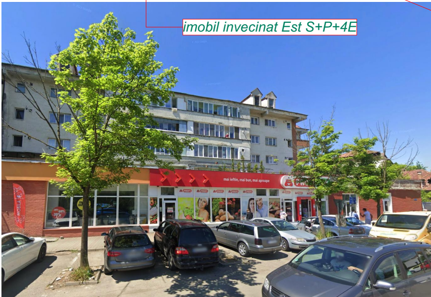
imobil invecinat Est S+P+4E