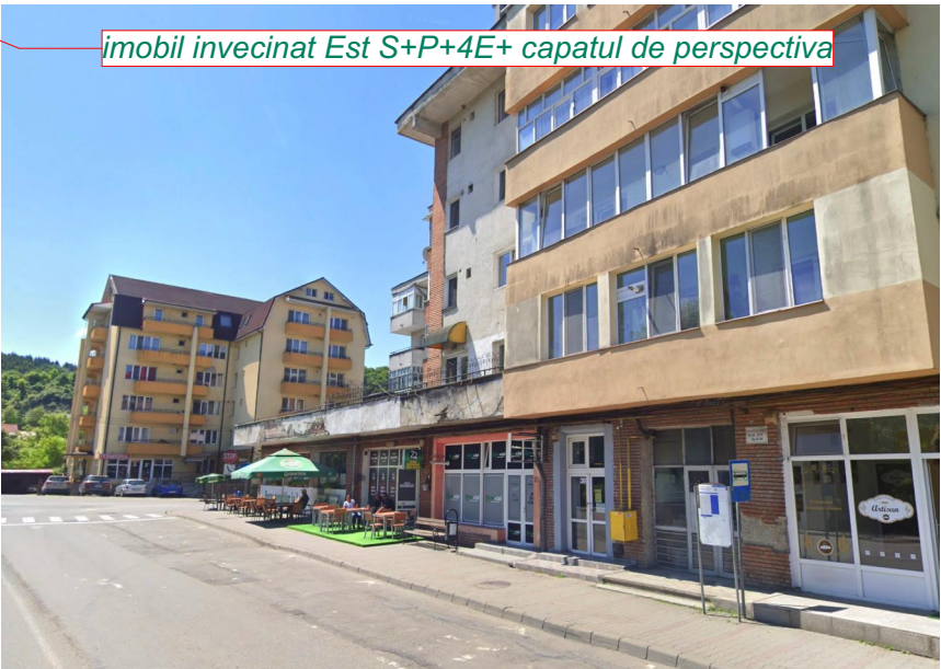
imobil invecinat Est S+P+4E+ capatul de perspectiva