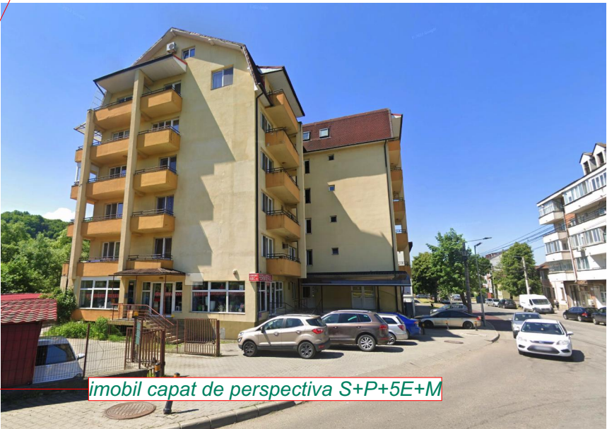
imobil capat de perspectiva S+P+5E+M