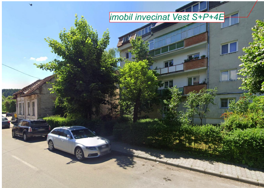
imobil invecinat Vest S+P+4E